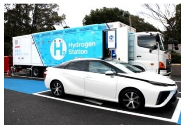
イワタニ水素ステーション 福岡県庁 （福岡市博多区東公園）