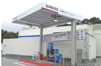
八幡東田水素ステーション （北九州市八幡東区東田）