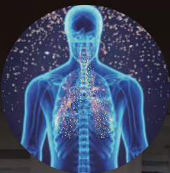
浮遊菌・ウイルスを除菌

空気中に浮遊する菌・ウイルス花粉などアレルギーをオゾンと紫外線が不活化 さらにドアノブや床・家具などに付着する菌やウイルスなども除菌が可能